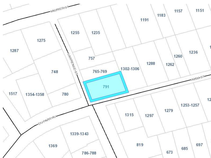
Figure 1. Carte Index

présente les dimensions approximatives suivantes : une façade d'une largeur de 20 mètres (65 pieds), une profondeur de 34 mètres (111 pieds) d'un côté, et de 36 mètres (119 pieds) de l'autre. La superficie est environ 735 mètres carrés (7911 pieds carrés ou 0.18 acre).